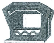
ซุ้มทรงเพชรที่ 1