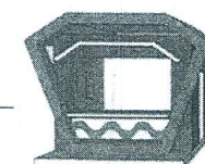
ซุ้มทรงเพชรที่ 3