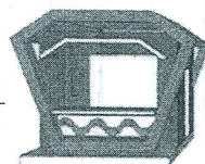
ซุ้มทรงเพชรที่ 2